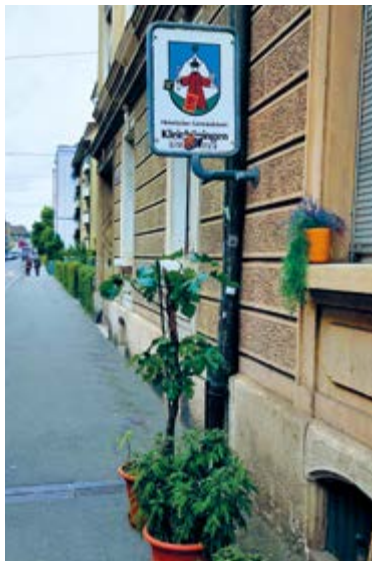
unscheinbar: das Gemeindebannschild

• Der Flurname „Zuschüttung“ bezieht sich auf eben diese eines alten Rheinarmes, um Fläche für den Bau von Hafensbahn und Gleisfeld zu gewinnen. In Zukunft soll das Areal Platz für 8000 Bewohner in Kleinhüningen bieten, was