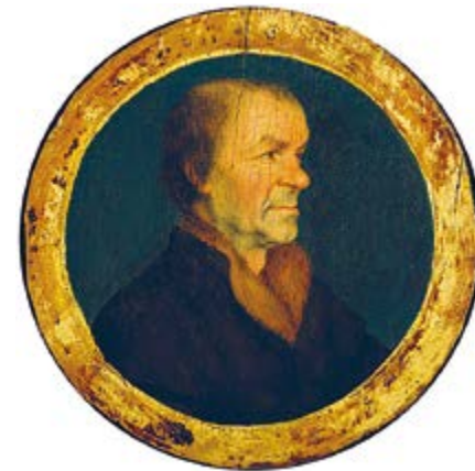
Johannes Froben (um 1460–1527), porträtiert von Hans Holbein d.J.

wollte den unbekanntem Verleger im fernen Basel persönlich kennen lernen.