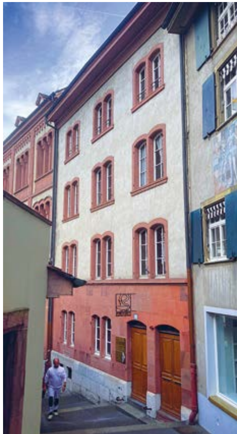
das Haus „zum Sessel“ im Totengässlein