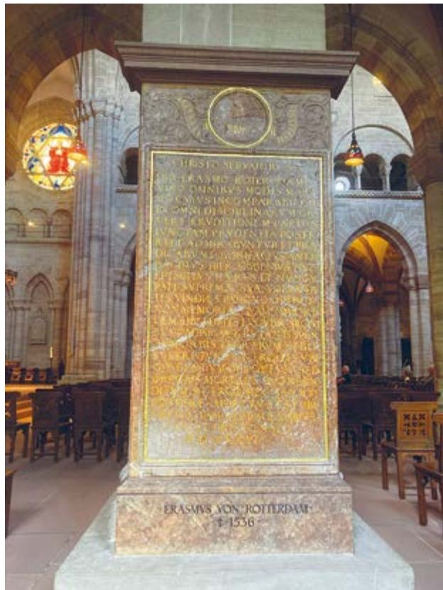
Epitaph im Chor des Basler Münsters

Am 12. Juli 1536 stirbt der grosse Erasmus von Rotterdam; dass er im protestantisch gewordenen Basler Münster beigesetzt wird, zeugt von dem hohen Ansehen, das er als Katholik auch nach seinem Tod geniessen durfte. Die Inschrift auf der Grabplatte – natürlich in Latein – lautet übersetzt: Desiderius Erasmus von Rotterdam, ein in jeder Hinsicht gebildeter Mann und Zierde der gesamten Gelehrtenwelt, liegt hier begraben.