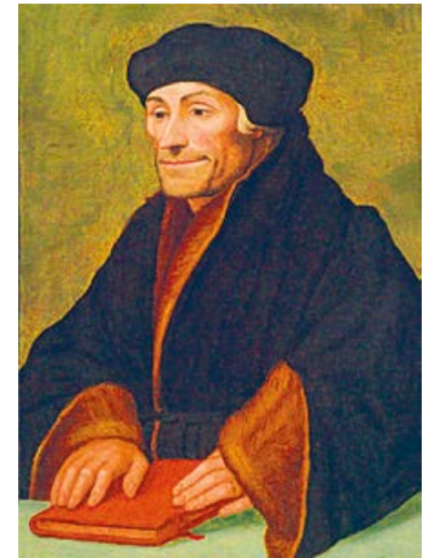
Erasmus von Rotterdam (1466–1536), porträtiert von Hans Holbein d.J.

Als der grosse Gelehrte im Herbst 1521 wieder nach Basel kommt, spürt er Veränderungen: Luthers radikales Gedankengut wird auch hier von Leuten wie Zwingli oder Oekolampad verbreitet und spaltet die Bevölkerung in zwei Lager. Erasmus, der zeitlebens für Toleranz und Ausgleich eingestanden ist, gerät plötzlich zwischen die Fronten, weil