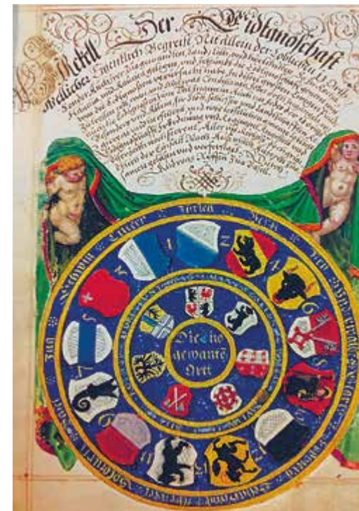
„Zirkell der Eidgenossenschaft“, Chronik von Andreas Ryff, 1597 2

Dieses Gleichgewicht und der Schutz durch die schweizerische Neutralität bewahrten Mülhausen 100 Jahre später während des Dreissigjährigen Kriegs vom grausamen Schicksal des übrigen Elsass, das durch diesen fast ganz verwüstet wurde, nicht zuletzt durch die schwedischen Truppen, die man in Mülhausen zunächst als Glaubensbrüder betrachtet hatte. Als Folge ihrer Raubzüge flüchteten 1638 mehr Menschen aus der Umgebung in die Stadt, als diese Einwohner hatte. Als die Habsburger drohten, Mülhausen zu erobern, rettete Kardinal Richelieu die Situation, indem er mit einem Gegenschlag drohte. Er berief sich dabei auf das Bündnis der Stadt mit den Eidgenossen, die jedoch Mülhausen mit ihren lediglich etwa 100 dort stationierten Soldaten nicht hätten verteidigen können.