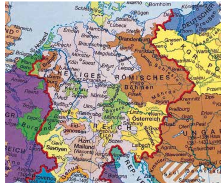
Karte des Heiligen Römischen Reiches um 1400; gelb eingefärbt Österreich und die habsburgischen Vorlande

Er vermittelte im Auftrag des Konzils im Krieg Österreichs gegen Burgund um den Sundgau, diente Burgund als Gesandter beim Konzil und war dann Kaiser Sigismunds Stellvertreter bei der Kirchenversammlung.