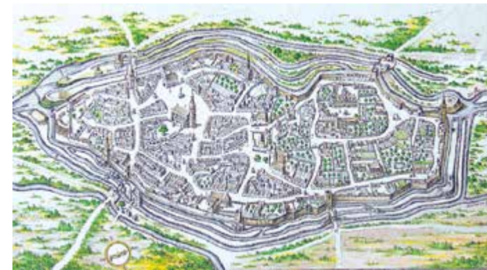
Merian-Plan von Mülhausen von 1642, seit 1666 als Glasmalerei im Sitzungssaal des alten Rathauses

Diese lehnten einen Vollbeitritt jedoch ab, sodass sich Mülhausen 1515 mit dem Status eines „zugewandten Orts“ begnügen musste, der in der Tagsatzung nur als Beobachter ohne Stimmrecht zugelassen war. Dennoch musste es sich verpflichten, den Eidgenossen zur Hilfe zu eilen, was in jenen kriegerischen Zeiten oft zur Anwendung kam.