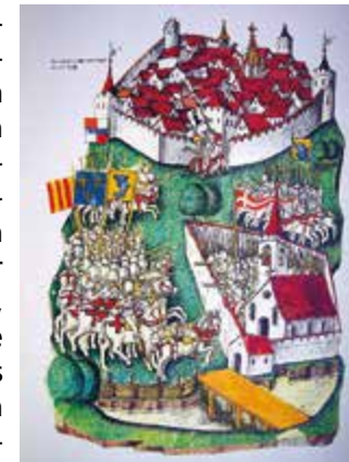
Die Schlacht von St. Jakob an der Birs, 1444 (Chronik Tschachtlan, 1470)