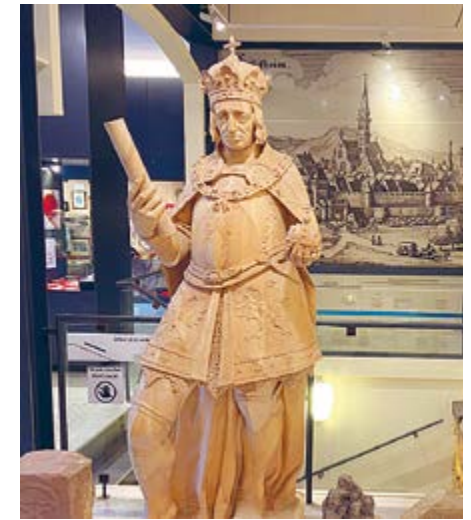
Statue von Kaiser Maximilian I. (1459-1519) im Museum in Ensisheim

Umso wichtiger ist die aktive Beteiligung der Ensisheimer Schulen an dem aktuellen Habsburgerprojekt im Herbst: Über 400 historisch kostümierte Kinder und Jugendliche werden im Rahmen der Sonderausstellung das präsentieren, was sie unter dem Motto „Retour au temps des Habsbourg“ in den vergangenen Monaten erarbeitet haben. Und über dieses Engagement der Schulen kommen auch die Eltern der Kinder in Kontakt mit der Habsburgergeschichte.