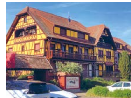
Hotel/Restaurant Parc des Cigognes

Nach einem Kaffee/Gipfeli-Halt irgendwo unterwegs wird Herr Wurtz von der Association des Amis de l'Eglise Historique die eine Gruppe in und um dieses markante Gotteshaus führen, während die andere auf einem Spaziergang durch die Grand'Rue überraschend viele historische Gebäude entdeckt.