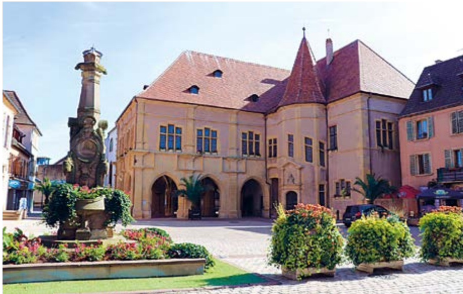
Der frisch renovierte Regierungssitz der österreichischen Vorlande in Ensisheim