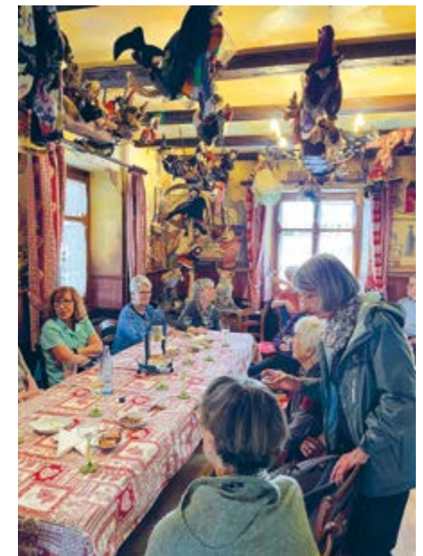
Der Himmel im „Burachus“ in Werentzhouse hängt voller Hexen

Das Musée des Amoureux et du Patrimoine Sundgauvien ist im Juli und August jeden Sonntag von 14:30–18:00 geöffnet. Das Burachus jeweils Freitag, Samstag und Sonntag von 09:00–23:45.