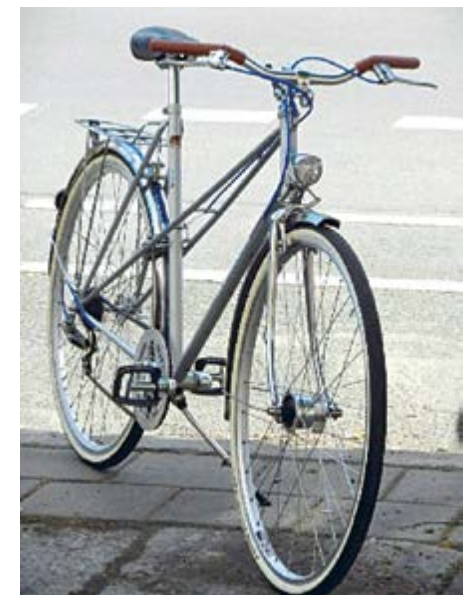
modernes Bicyclette, Mixte- bzw. Berceau-Rahmen

Die Entwicklung weg vom gefährlichen Hochrad zu „normalen“ Fahrrädern verlief – der steigenden Verkehrsdichte sei Dank – äusserst rasant. Von Beginn weg – ab 1885 – bot Peugeot Damen- und Herrenmodelle an, anfangs noch Starrantriebe (neudeutsch „Fixies“) aber schon bald mit Freilauf und Löffel- oder Klotzbremse.