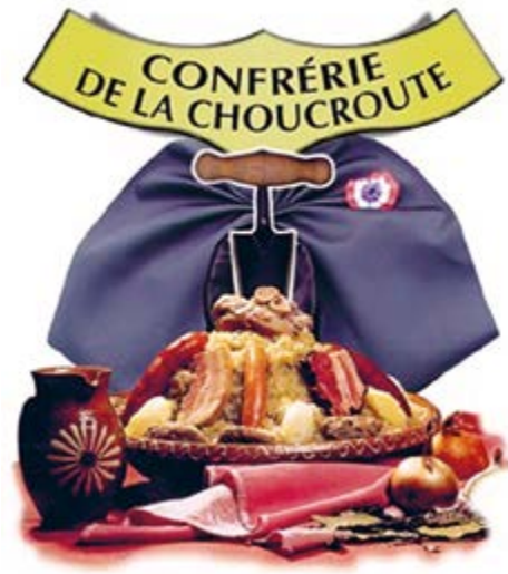
Das Bild spricht für sich...

Anlässlich der Gründung anno 1987 schrieb sich die Confrérie in ihre Statuten: