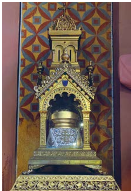
das Reliquiar im Chor der Kapelle

Gleich nach seiner Beisetzung im Petersdom in Rom wurde der verstorbene Papst heiliggesprochen. Und wie es sich für den Geburtsort eines Heiligen gehört, besitzt Eguisheim zwei kostbare Reliquien von Leo IX.: einen Teil der Schädeldecke und einen Backenknochen, beide sorgsam verwahrt im vergoldeten Glockenturm-Schränklein aus dem 19. Jahrhundert.