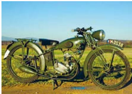
Peugeot P-53-1 von 1939 für Meldeläufer

Doch auch Peugeot musste sich ab 1914 der Kriegsrüstung anpassen und lieferte fast ausschliesslich ans französische Militär. Die gewonnenen