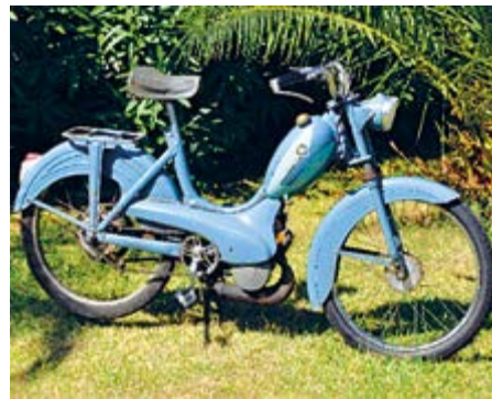
Peugeot Cyclomoteur 1957, 50 ccm

Leichtbau war das Resultat der Mangelwirtschaft und gipfelte in den bereits im ersten Teil genannten „Mobiledlä“, im Elsass die Sammelbezeichnung für flinke günstige Kleinmotorräder, welche ab den 50er-Jahren schnell, steuerbefreit und mit gefederten Vordergabeln uns durchgeschüttelten, braven eidgenössischen Mofa-Besitzern schamlos um die Ohren brausten. Die Hersteller waren mannigfaltig. Gemeinsame Erkennungsmerkmale waren 50 ccm-Motörchen, Fliehkraftkupplungen, Antriebe über Kette, Keilriemen, Reibrolle oder einer Kombination davon. Immer kommt ein Pedalantrieb wie beim Fahrrad hinzu – als ein reiner Not- und Startantrieb.