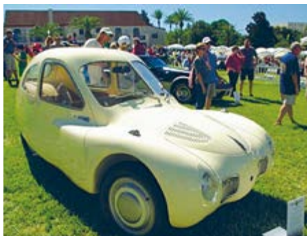
Mathis VL 333

Aber auch Konstruktionen neuer und revolutionärer Automobile entstanden – so schon 1946 das „3-Liter Auto“. Erst Ende der 90er-Jahre liess der VW-Konzern die Bezeichnung wieder aufleben, die damit verheissenen Eigenschaften konnten jedoch von VW nur sehr bedingt erfüllt werden.