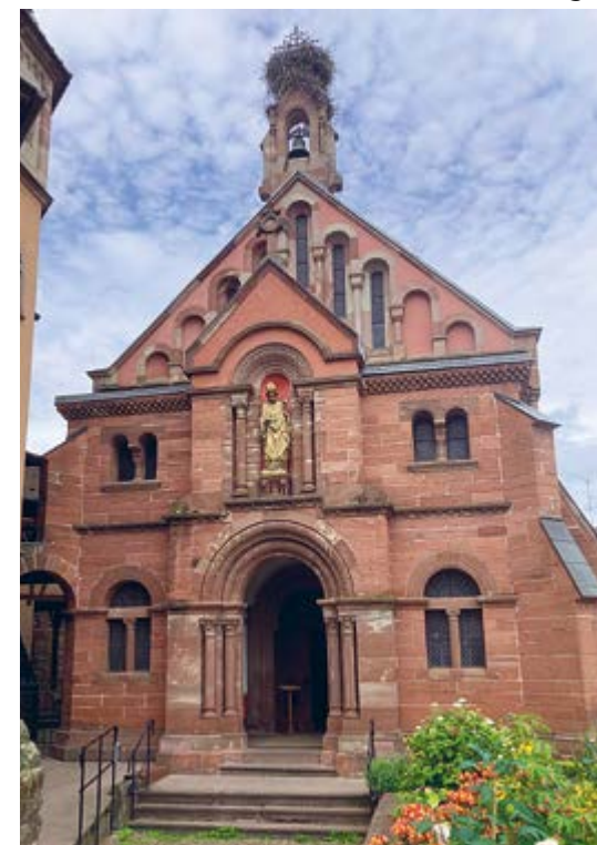
Die Kapelle auf den Grundmauern der ehemaligen Stadtbürg Egisheim

Auf langen Visitationsreisen durch ganz Europa weiht er viele Kirchen und stattet zahlreiche Klöster mit wichtigen Privilegien aus, was die Stellung der Kirche stärkt und letzt- lich mitentscheidend für den Aus- bruch des Investiturstreits ist. Auch als Papst bleibt Bruno von Egisheim ein treuer Gefolgsmann von Kaiser Heinrich III., agiert als Feldherr aller- dings unglücklich: Mit einem Söld- nerheer meint er die immer mäch- tiger werdenden Normannen aus Süditalien vertreiben zu müssen, er- leidet aber 1053 in der Schlacht von Civitate eine vernichtende Nieder- lage, weil das versprochene Reichs-