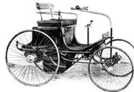
Peugeot „sans Cheval“ 1891

1891 eine „Kutsche ohne Pferd“ das Werk, betrieben mit einem Motor von ... Daimler.