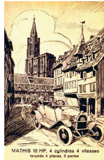
Affiche populaire, Mathis um 1926

Mathis konstruierte in der ab 1911 gebauten Fabrik südlich von Strassburg kleine leichte Fahrzeuge für den Alltagsgebrauch – „ Le poids, voilà l'ennemi “, ein späterer Werbeslogan. Er bestritt mit erleichterten Strassenmodellen recht erfolgreich Rennen. Zu Beginn des 1. Weltkriegs desertierte Mathis aus der deutschen Armee, seine Fabrik wird beschlagnahmt und produziert fortan Sanitäts- und Nutzfahrzeuge für das deutsche Heer.