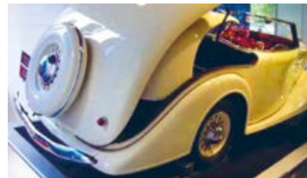
Peugeot 401, Eclipse 1935

1935 erschien am „401er Eclipse“ das erste im Kofferraum versenkbare 2-teilige Stahlblech-Dach, die Modelle wurden nur auf Bestellung gebaut, zum stolzen Preis etwa eines zeitgenössischen Cadillacs oder Bentley! Das Patent stammte vom Zahnarzt Georges Paulin, welcher einen Entwurf des Amerikaners George Ellerbeck zur Serienreife brachte.