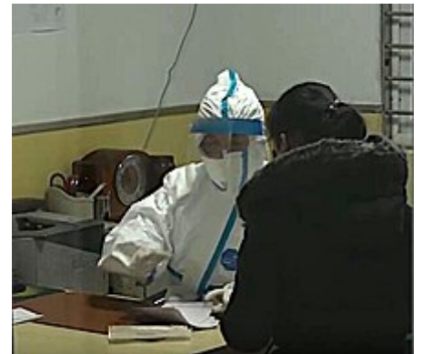
e Dokter im Schutzazug z Wuhan mit ere Paziäntin

Italie isch das öiropäische Land, wo de im Februar 2020 am meischte Covid-19 -Chranketsfäll gha het, fasch alli in ere Region vo der südliche Lombardei un z Venezie . Es paar Lüüt sind gstorbe. Bis Ändi Februar het me scho us meh weder dryssg Provinze vo Itaalie infizierte Paziänte gmäldet; es sind meh weder sächshundert, und sibezeää Lüüt im Land sind bis dohii a dr Chranket gstorbe, und meh weder hundert bis am 4. März. Wo sech d Chranket no vil mee usbreitet het, isch z Oberitalie d Region Lombardei ganz und s