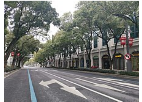
Mänschelääri Stroosse z Wuhan

Wuche drufabe het me no meh Stedt vo dr Provinz Hubei blockiert, und bi allne Gmeinde i dere Gägend sind d Stroosse gspeert und überwacht worde. Niemmer het me chönnen autofahre, nume d Rettigsfahrzүү, d Polizei und d Laschtwäage für die unbedingt nötige Transport sind underwägs gsi. Z Peking het me die grossi Fyyr vom chinesisches Nöijoor abseit. Wil s immer no meh Chrankni gää het, isch i de Spitäaler z Wuhan vil z wenig Platz gsi; drum het d Regierig vo China in wenige Tääg grossi nöji Notspitäaler lo boue, und me het de grad au no Sportstadie und anderi groossi öfentlichi Halle zu Notspitäler für nöji Paziänte umbout.