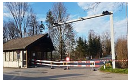
Da Zoll im Schmeatter bi Tippiizou ischt am Ziischtig, 17. März 2020 ganz zuegmacht wore – s Hoptzollamt isch offa pleba.

Am 13. März 2020, wo i dr Schwiiz offiziell mee weder tuusig Chranki gsi sind, het drno au dr Schwiizer Bundesroot entschiide, ab jetzt blube d Schuelen und Hochschuelen im ganze Land zue, und zwar bis mindeschtens am 4. April, und me töörffi au suscht keini Verastaltige mit mee als hundert Lüüt me mache. Dr Bundesroot het Gält freigää zum de Betriib vo dr Privatwirtschaft und de Kulturschaffende z hälfe, wo wäge dr Pandemy in Schwirikäite groote. Und er het gseit, me sell so wyt ass es goot nümme mit em öfentliche Vercheer umereise. [24] Und am 16. März isch dr Bundesroot e Schritt wytergange: er het nach Besprächige mit de Kantöön über s ganze Land s Noträcht, wo offiziell «usserordentlichi Laag» heisst, vrhängt. [25] Das bedüütet, d Wirtschaften und anderi öfentlichi Gaschtronomybetriib und Gschäft usserte dene, wo für d