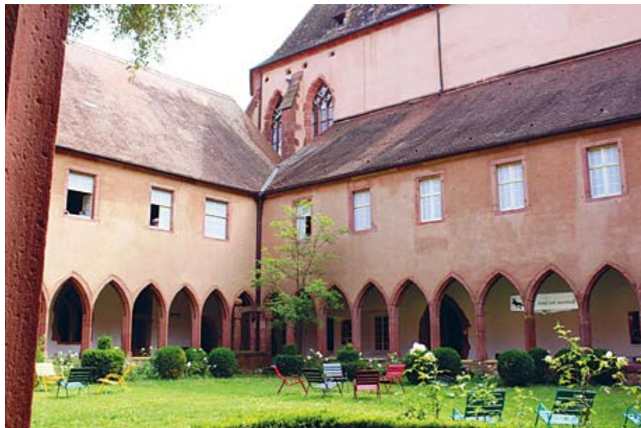
Der idyllische Kreuzgang des Klosters

Den Kaffee am Morgen gibt es in der neu eröffneten Auberge de l'Abbaye am Dorfeingang von Murbach. Fürs leibliche Wohl am Mittag sorgt der Küchenchef des Restaurants „à la Truite“ in Lautenbach-Zell. Und vor der Rückfahrt sollte in Guebwiller noch etwas Zeit bleiben, um den obligaten Gugelhopf oder einen anderen Bhaltis mit nach Hause zu nehmen.