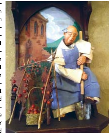
Ein fleissiger Mönch in der „Ferme des Moines“ in Thierenbach F-68500 Jungholtz

Ab 1830 setzt die eigentliche Industrielle Revolution ein – literarisch ausgedrückt: Der faustische Geist breitet sich aus. Dieser fragt: Was hält die Welt im Innersten zusammen? Dies ist eine neue und neuartige Fragestellung. Zugespielt ausgedrückt hiesse die Antwort: An die Stelle der alles umfassenden Religion tritt die Industrie (industria, lateinisch: Fleiss, Mühe). „Bete und arbeite“ wird reduziert auf blosses Arbeiten.