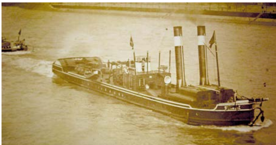
Heckrad-Dampfschleppboot SCHWEIZ, gebaut 1919 bei Cäsar Wollheim in Breslau, erstes Schleppboot unter Schweizer Flagge