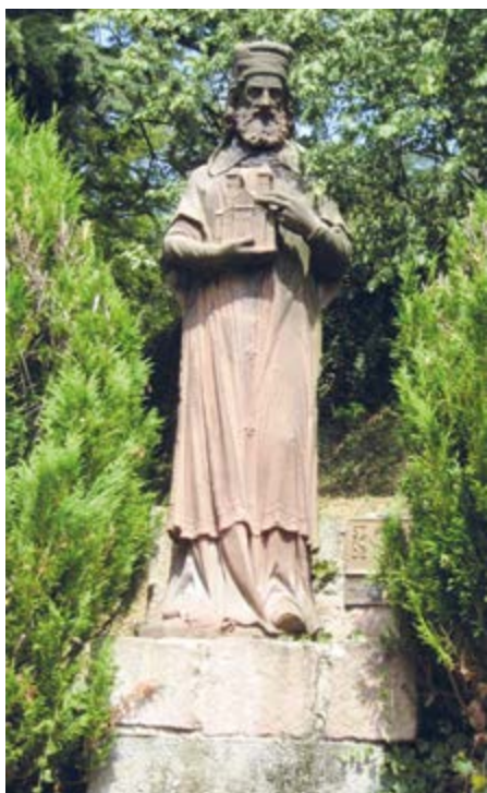
Bischof Pirmin, der erste Abt von Murbach

hundert in den Mauern des Klosters Murbach. Gestiftet vom Merowingergrafen Eberhard und 728 urkundlich belegt, war Murbach das erste elsässische Kloster unter der Benediktinerregel. Eberhard beauftragte den Bischof Pirmin, einen Wandermönch vom Bodensee, mit der Errichtung einer Abtei, die innerhalb eines Jahrhunderts wegen ihrer reichen Bibliothek und dem ausgezeichneten Studienniveau der Mönche hohes Ansehen erlangte.