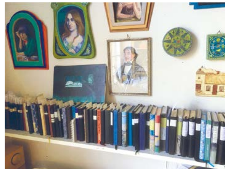
Die legendären Skizzenbüchlein: fein säuberlich angeschrieben und chronologisch aufgereiht

An die verschiedensten Stationen ihrer „Basler Zeit“ erinnern farbige Bilder an den Wänden, Mappen mit grossformatigen Bleistiftzeichnungen, Stapel von Alben und natürlich