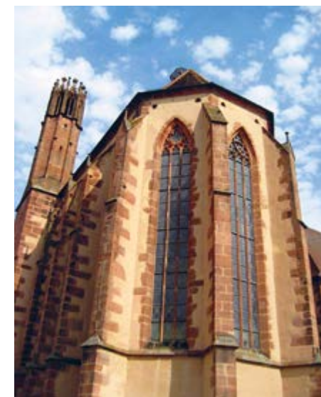
Die Kirche des Dominikanerklosters in Guebwiller

Dass sich in unmittelbarer Nachbarschaft des Benediktinerordens Dominikaner niederliessen, ist im Mittelalter nichts Aussergewöhnliches; im Fall von Guebwiller taten sie das sogar auf Geheiss des mächtigen Klosters Murbach. Das geschah allerdings erst im 13. Jahrhundert, und das Dominikanerkloster erlangte nie die Stellung und den Einfluss des grossen Bruders.