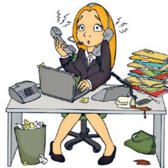
Keine Angst: ganz so hektisch ist die Arbeit nicht!