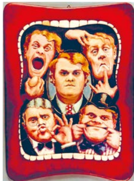
Die Lehre von der „Faceologie“ blieb der Nachwelt leider vorenthalten – das Buch erschien nie!